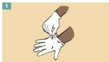
1 Grasp the outside of one glove at the wrist. Do not touch your bare skin.