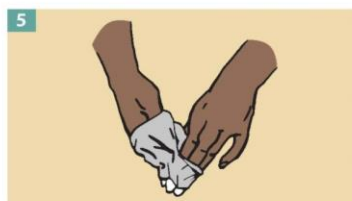
5 Turn the second glove inside out while pulling it away from your body, leaving the first glove inside the second.