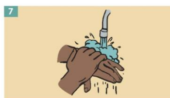
7 Clean your hands immediately after removing gloves.