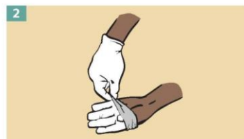
2 Peel the glove away from your body, pulling it inside out.