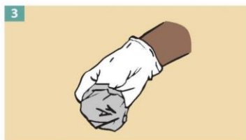
3 Hold the glove you just removed in your gloved hand.