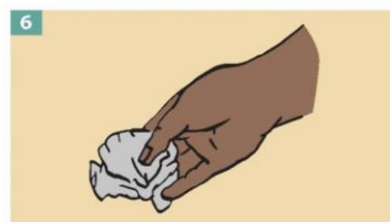
6 Dispose of the gloves safely. Do not reuse the gloves.